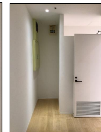
ストックルーム内